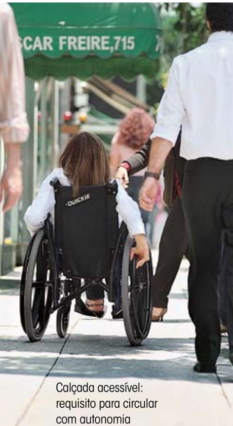
Calçada acessível: requisito para circular com autonomia

Para entender a pessoa que tem uma deficiência é preciso enxergar a pessoa, não a deficiência