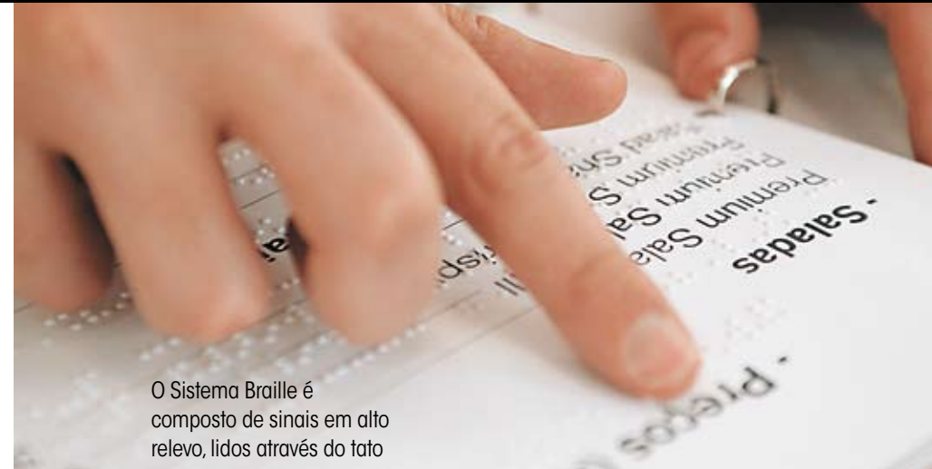
O Sistema Braille é composto de sinais em alto relevo, lidos através do tato

O computador é um importante aliado na comunicação de pessoas com cegueira, baixa visão e surdez. A melhoria dos recursos de acessibilidade – como sistemas de voz que leem as informações dos sites e correio eletrônico, e animações que traduzem o texto para a Libras, permitem ampliar a rede de relacionamento desses públicos. Assim como os celulares, já que surdos estão entre os principais usuários dos serviços de mensagens de texto.